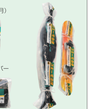
スキー・スノーボード マルチカバー