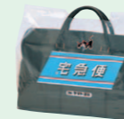
ポストバッグカバー (1986年11月)