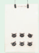
クロネコバッグ (1990年)