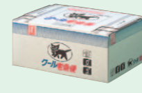
クール用ボックス (1988年10月)