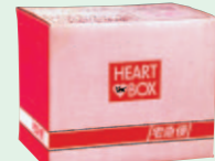
ハートボックス Sサイズ(1979年3月) Mサイズ(1982年3月)