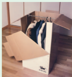
ハンガーボックス