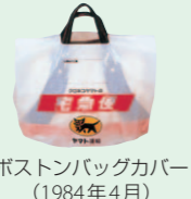
ポストバッグカバー (1984年4月)