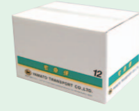
クロネコボックス (2006年)