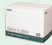
クロネコボックス (1989年6月)