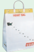
ハートバッグ (1983年1月)