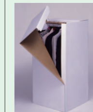
ハンガーボックス