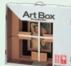
アートボックス (1988年2月)