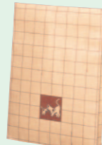
クロネコバッグP (1986年)