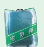
スキーザック カバー