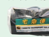
ポストバッグカバー (2006年)