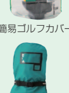
簡易ゴルフカバー