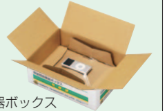
薄型精密機器ボックス