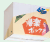
帰郷ボックス (1986年3月)