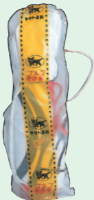
簡易ゴルフカバー (1984年4月)