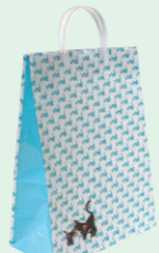
クロネコバッグ (1986年)