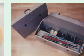
シューズ・傘専用ケース(右) ガラス戸・額専用ケース(左)