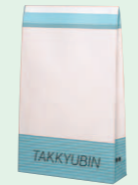
クロネコバッグ (1990年)