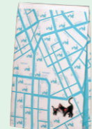
クロネコバッグA・B (1986年)