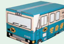
ウォークスルーボックス (1989年11月)