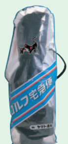
簡易ゴルフカバー (1987年8月)