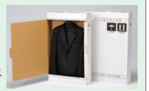
ハンガーボックス (1着用)