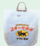
スキーザックカバー (1983年12月)