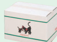
クロネコボックス (1986年3月)