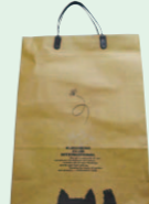
クロネコバッグ (1988年)