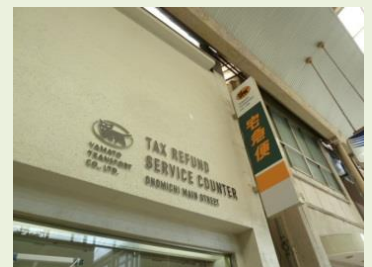
広島県尾道市の商店街では、「TAX REFUND SERVICE COUNTER」として、一括免税の他、宅急便の受付も対応。

商業施設や商店街の別々の店舗でお買い上げいただいた商品の免税手続きを一括で行う「一括免税カウンター」を展開しています。現在は、北海道札幌市、旭川市、宮城県仙台市、広島県尾道市の全国4箇所で開催しています。