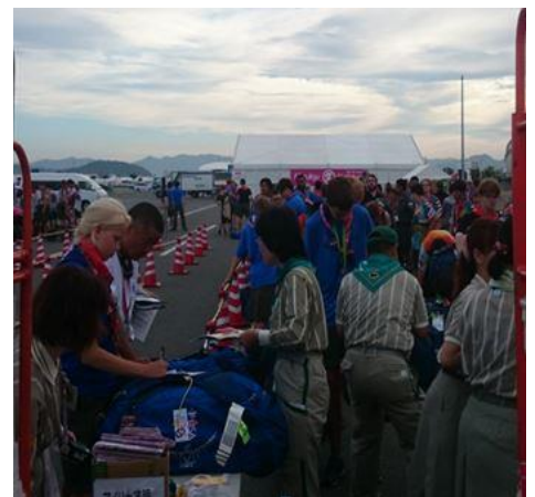
世界152カ国3万3,838人が参加した「世界スカウトジャンボリー」