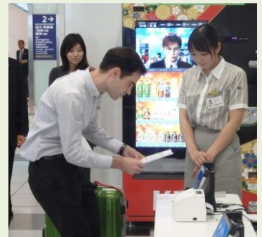
羽田、成田、中部国際空港などを中心に全国7空港で展開

また、駅や観光案内所に隣接した施設での手荷物の一時預かり、近隣施設(エリア限定)への当日配達、一部地域では観光案内も実施しています。