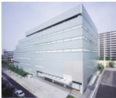
新東京センター(東陽町)

03年4月には、東京都江東区に新データセンターが完成。サービス内容を拡充する体制を整え、積極的な営業活動を推進しています。