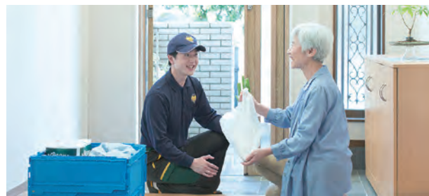
複数店舗でのお買い上げ品を一つにまとめてお届け

ヤマトグループは今後も、地域の皆様、地域事業者・団体と一体となり、子育て世代や高齢者など、世代を問わず、安心・快適な生活を送ることができる街づくりを推進していきます。