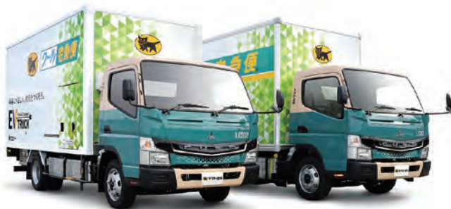
三菱ふそうが開発した電気小型トラック「eCanter」

また、EVや再生可能エネルギーの導入などを促進していくため、2021年10月、ヤマト運輸に「グリーンイノベーション開発部」を新設しました。同部の「エネルギーマネジメント課」では、当社グループのCO 2 削減に加え、省エネ技術の活用や再生可能エネルギー由来の電力の利用などを検討していきます。また、「モビリティ課」では、モビリティを起点に最新のテクノロジーの研究と実証に取り組み、実装を目指します。