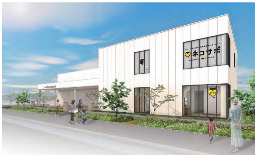
ネコサポステーションFujisawa SST店