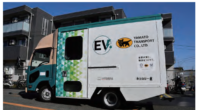
いすゞ自動車が開発したEVウォークスルートラック