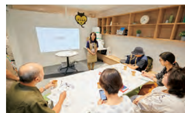
地域密着型イベント (メルカリ出品体験)